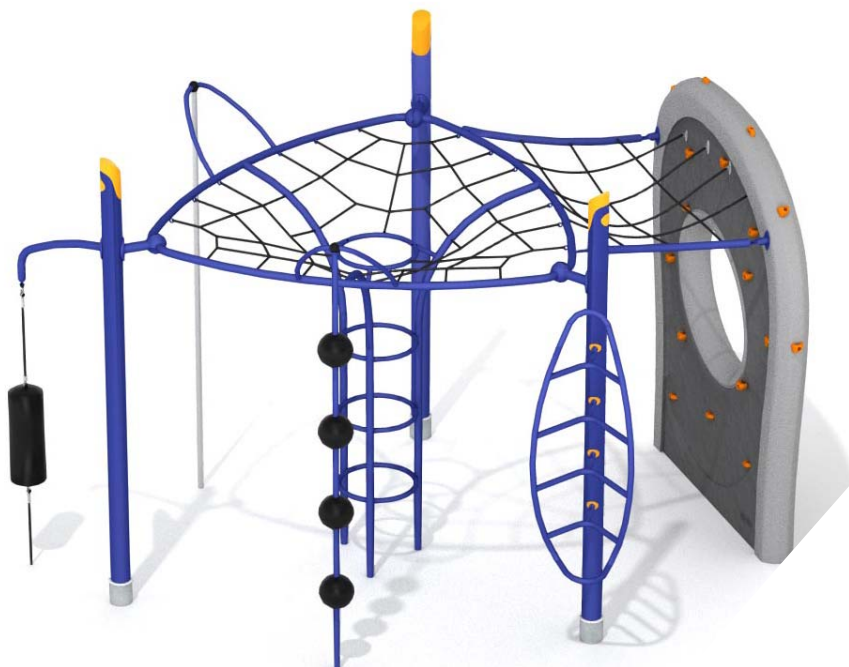
CEDRUS 144 522